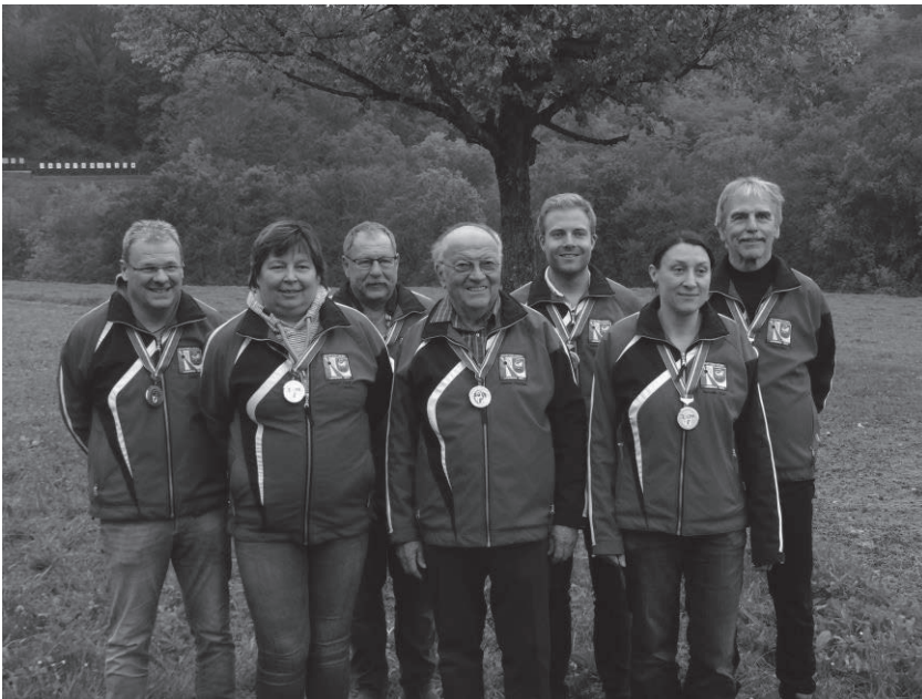
Die siegreiche Mannschaft des SV Liesberg