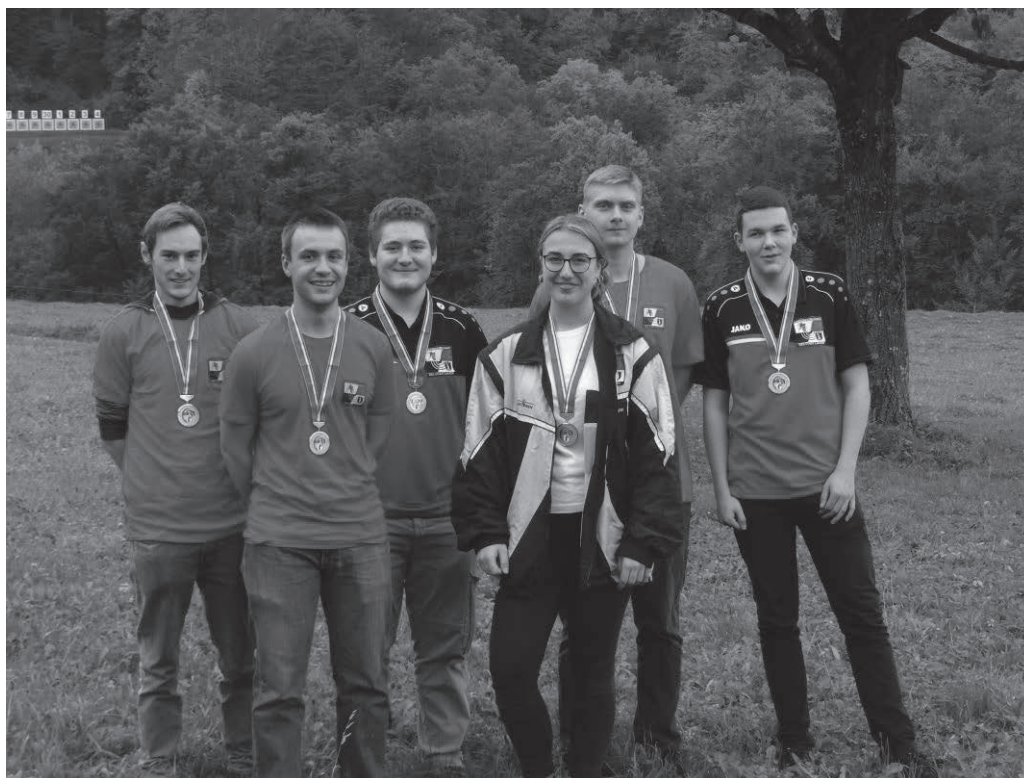
Die siegreiche Mannschaft der SGS Laufen nach der Rangverkündigung vom 19. Oktober in Sissach

Im Gegensatz zur Gruppenmeisterschaft war die Mannschaftsmeisterschaft im Kanton Baselland fest in Laufentaler Hand. Mit Brislach, Dittingen, Laufen und Zwingen hatten sich 4 Sektionen für den Final mit 5 Sektionen qualifiziert. Leider konnte Dittingen aus Mangel an Schützen nicht teilnehmen. An diesem Tag war es ein Kopf an Kopf Schiessen zwischen Laufen und Ziefen, wobei die SGS Laufen mit 873 zu 872 Punkten das bessere Ende für sich hatte. Auf Rang 3 klassierten sich die Schlümpfe aus Brislach mit 855 Punkten und Platz 4 ging an Zwingen-Nenzlingen. Wir gratulieren der SGS Laufen zum Gewinn der Kantonalen Mannschaftsmeisterschaft.